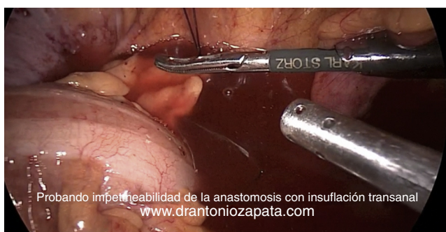
Figura 5 Probando impermeabilidad de la anastomosis con insuflación transanal.

Posterior a realizar la anastomosis, hacemos una «prueba de la llanta» (fig. 5) que consiste en introducir una sonda nelaton 20 Fr transrectal e insuflarla con aire, para llenar el hueco pélvico con agua y observar la impermeabilidad de la anastomosis. Por último se deja drenaje y se procede al cierre de puertos.