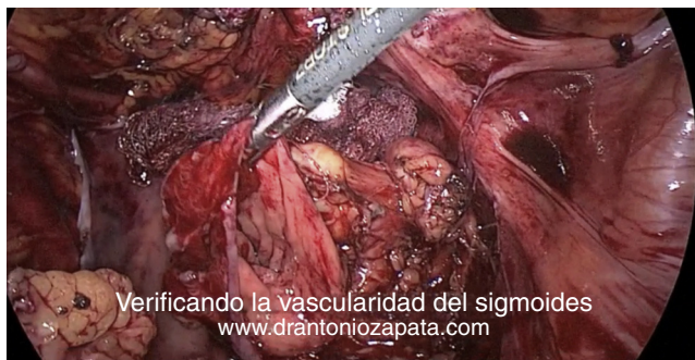
Figura 3 Verificando la vascularidad del sigmoides.