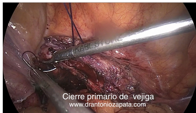
Figura 2 Cierre primario de vejiga.

Se reseca el componente sigmoideo de la fístula hasta encontrar tejido sano, se cierra con puntos separados totales de vicryl 3-0.™.