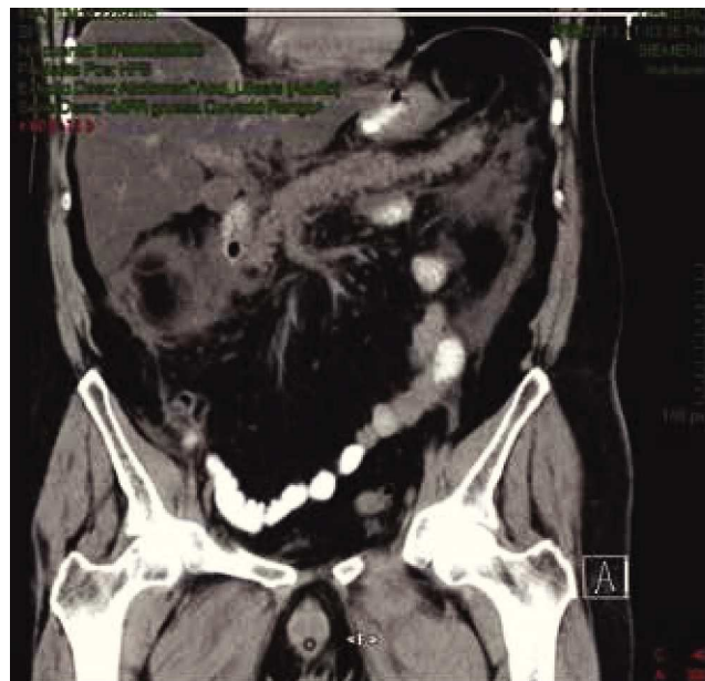
Figura 2 Caso 2. Tomografía axial computarizada abdominal con evidencia de pancreatitis, Balthazar E.

tórpida con insuficiencia renal aguda, deterioro ventilatorio y circulatorio, con defunción en ambos casos.